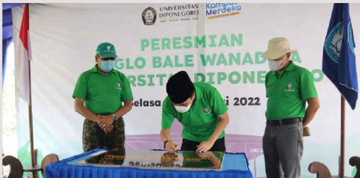
Penandatanganan Prasasti Joglo Bale Wanadipa oleh Rektor Undip