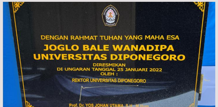
Prasasti Joglo Bale Wanadipa KHDTK Undip di Penggaron